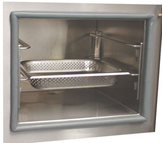
Binnenruimte geschikt voor geperforeerde 2/3 pannen